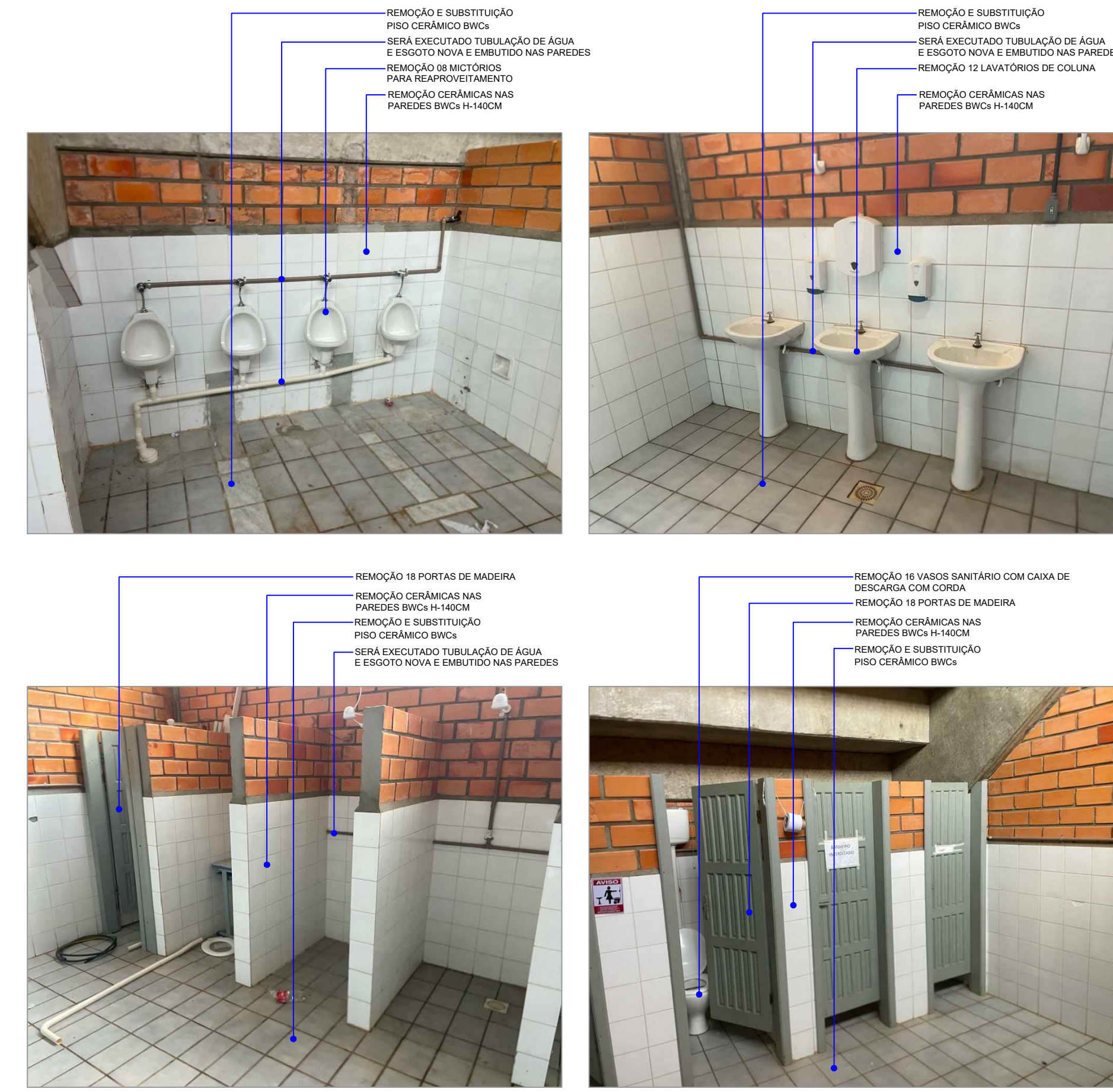
DETALHES DAS REMOÇÕES DOS BWCs Escala Visual