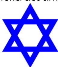
ESTRELA DE DAVI